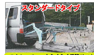
ストレッチャーもらくらく乗降リフト