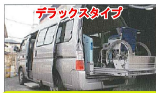
ナビ・ETC・デュアルエアコン

ご家族の旅行・施設への代車・病院の送迎等に ご希望日時にご希望場所へ納車/引取りいたします